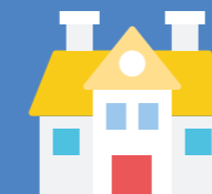
• Au service