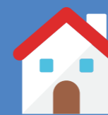
• À domicile

Au plus proche de vous, sur vos lieux de vie